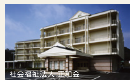
社会福祉法人 正和会