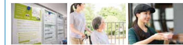
多様な募集があります 介護施設 飲食店

食品工場や介護施設を中心に、豊富にアルバイトがあります。勤務を希望する学生全員がアルバイトをしています。